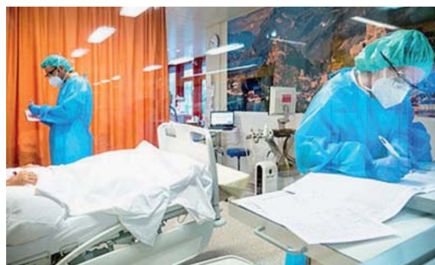
Le nombre d'hospitalisations provoquées par le coronavirus marque une légère baisse. HÔPITAL DU VALAIS

Toujours pas de répit par contre au niveau des décès. Depuis le début de la pandémie, le Valais a dû déplorer 315 morts liées au coronavirus. Le chiffre annoncé par le Service de la