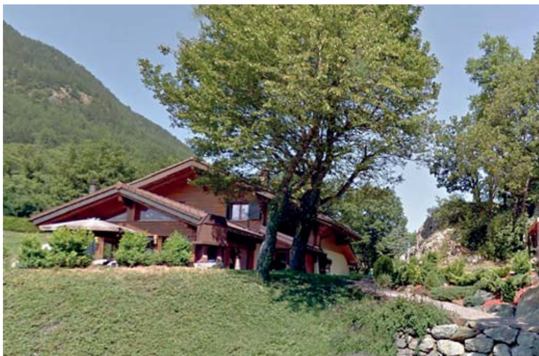
Exemple de calcul de stockage Horizon pour une maison individuelle (à droite).