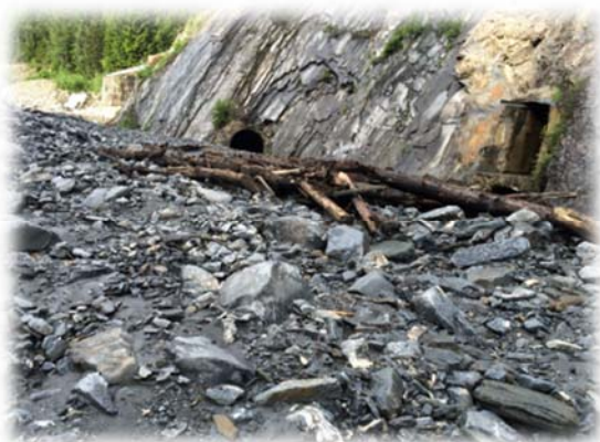
Après la crue

Suite aux fortes précipitations du 06.06.2015, le torrent Tollent charrie d'énormes quantités de matériaux (environ 20'000 m 3 ) qui obstruent les canaux de chasse et de purge de la prise. De plus, les matériaux ont comblé le lit du torrent Tollent. Les opérations de purge et de chasse n'étaient plus possibles. Il a fallu 5 jours d'intervention avec une pelle Rétro pour le dégagement de la Dranse et du torrent Tollent.