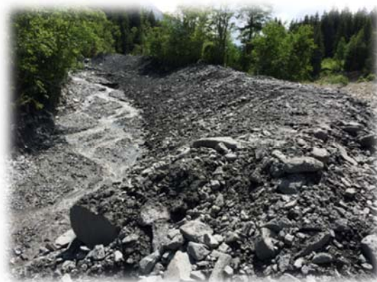
Après le dégagement